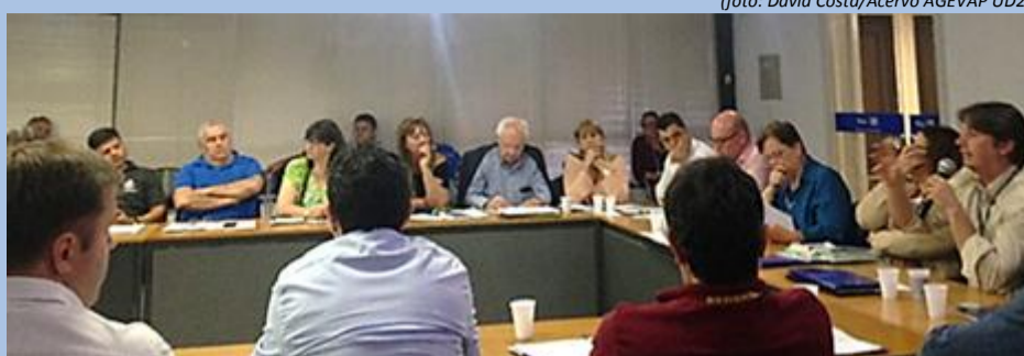
Representante do Comitê Piabanha participa de reunião sobre licenciamento e outorga