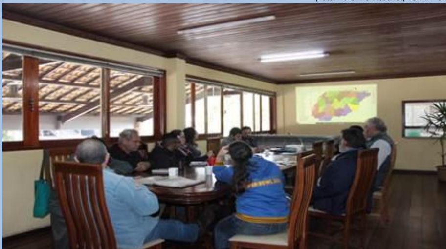
GTs do Comitê Piabanha durante reunião

No dia 11 de julho, foram realizadas a 5ª Reunião do Grupo de Trabalho Educomunicação e a 13ª Reunião Grupo de Trabalho Sistemas de Informação do Comitê Piabanha. Os encontros aconteceram na sala de reuniões da Secretaria de Serviços, Segurança e Ordem Pública, em Itaipava/RJ. O GT-Educomunicação, pautou discussões acerca do planejamento de ações para a divulgação do Atlas da RH-IV, das propostas de ações do grupo para 2018 e da proposta do ECOB 2019 ser realizado no município de Teresópolis/RJ.