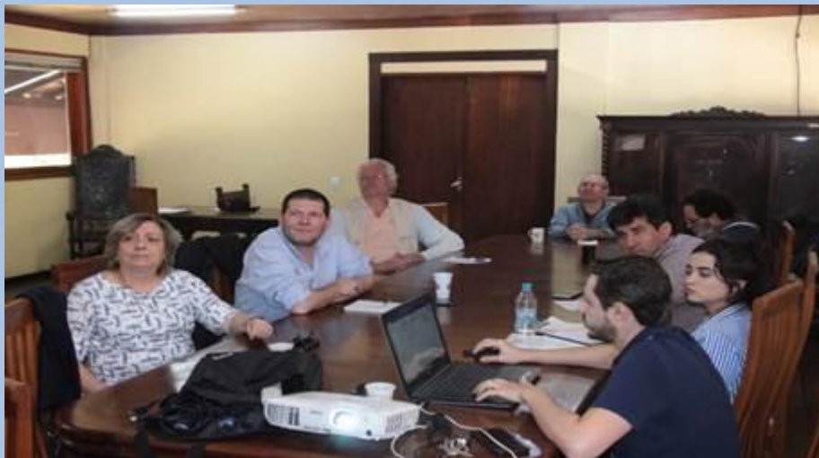
Diretório do Comitê Piabanha e membro da CT se reúnem para tratar do Termo de Referência