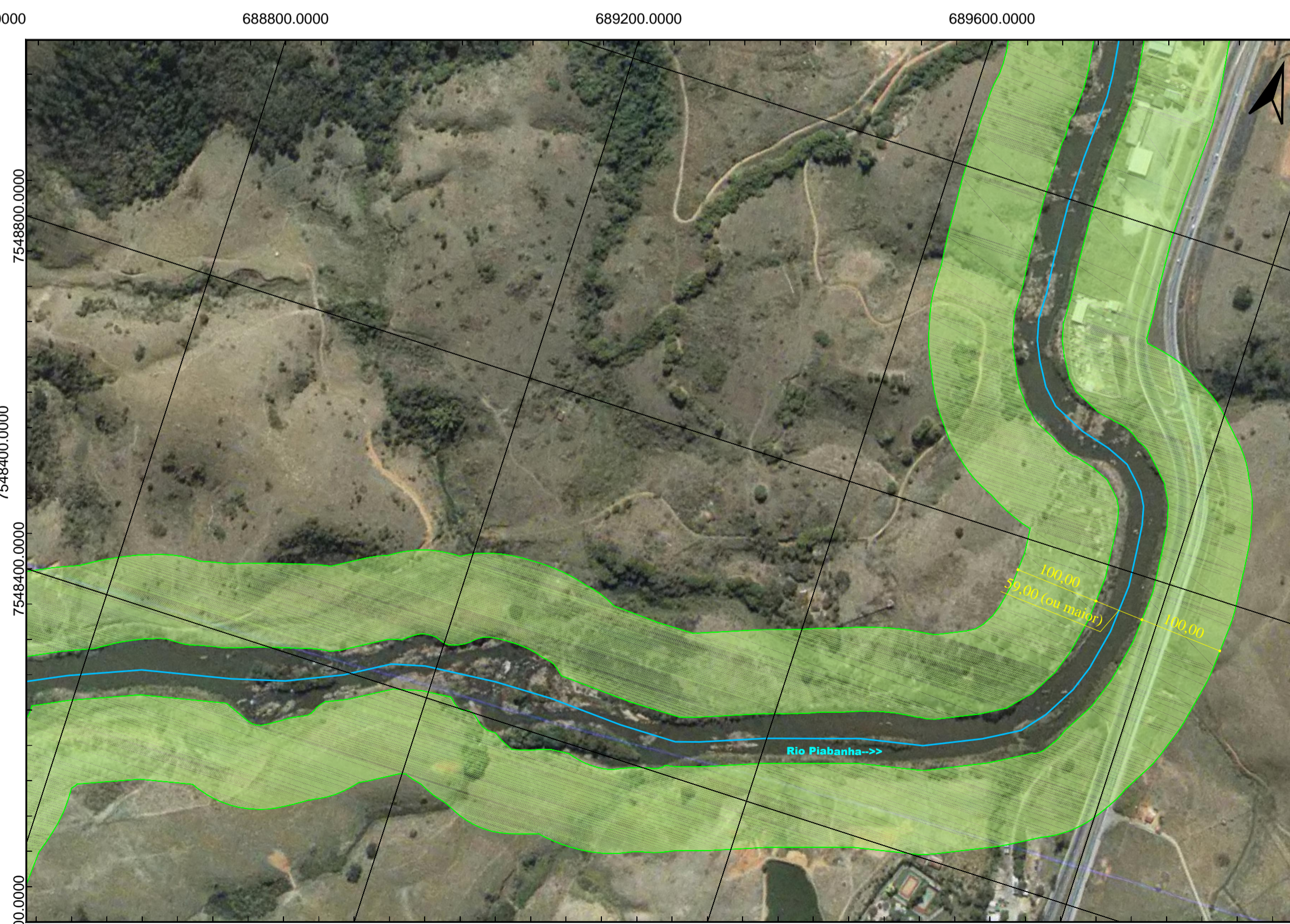
3 TRECHO 34 ESCALA - 1:5.000