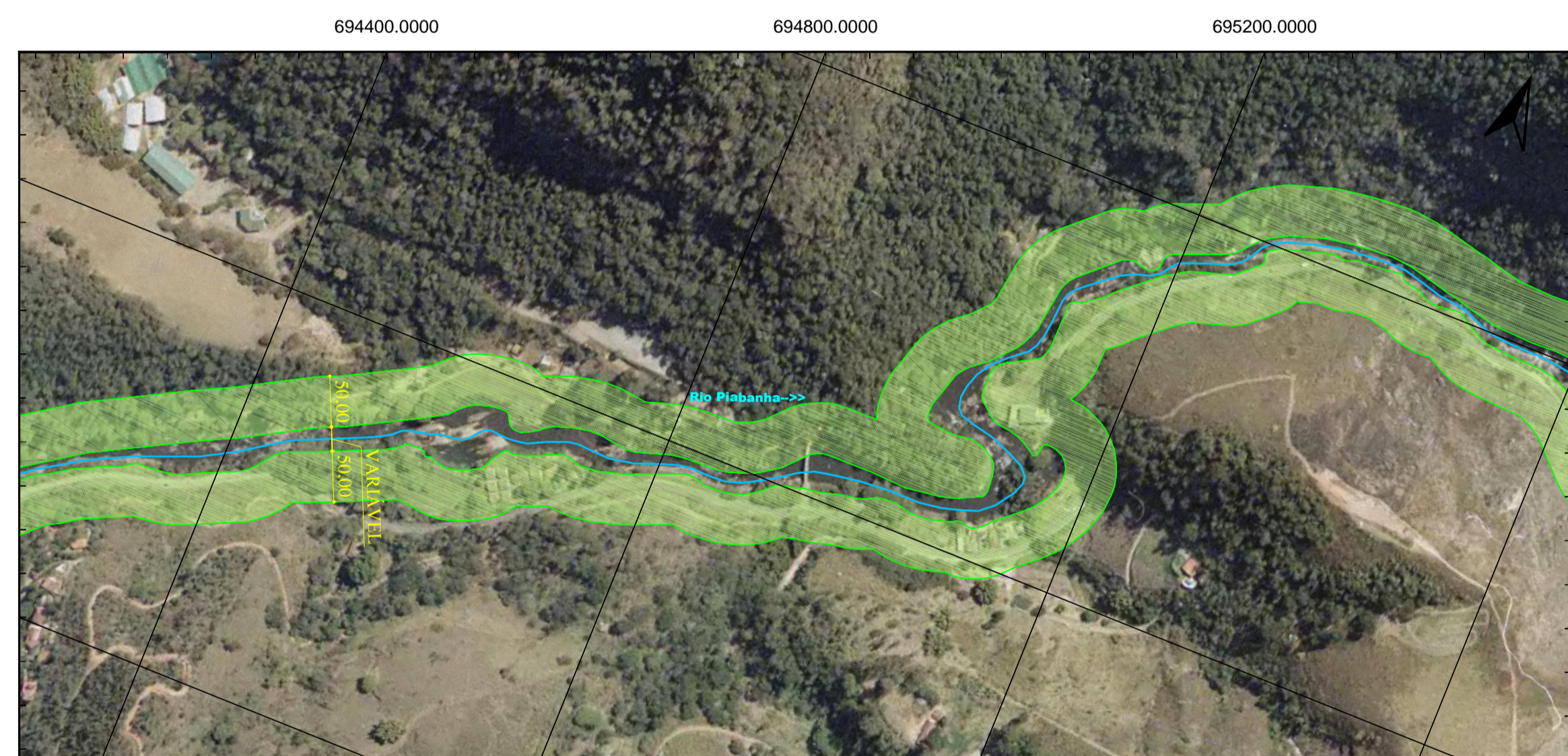
3 TRECHO 19 ESCALA - 1:5.000