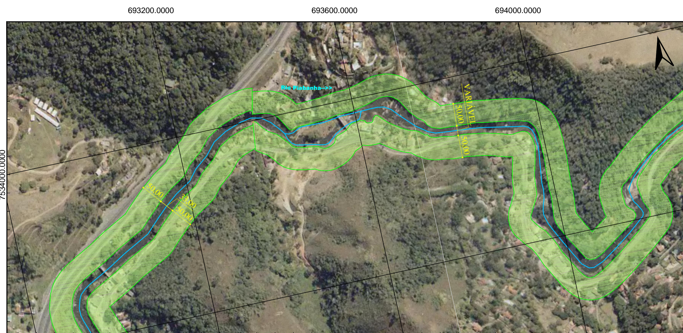
2 TRECHO 18 ESCALA - 1:5.000