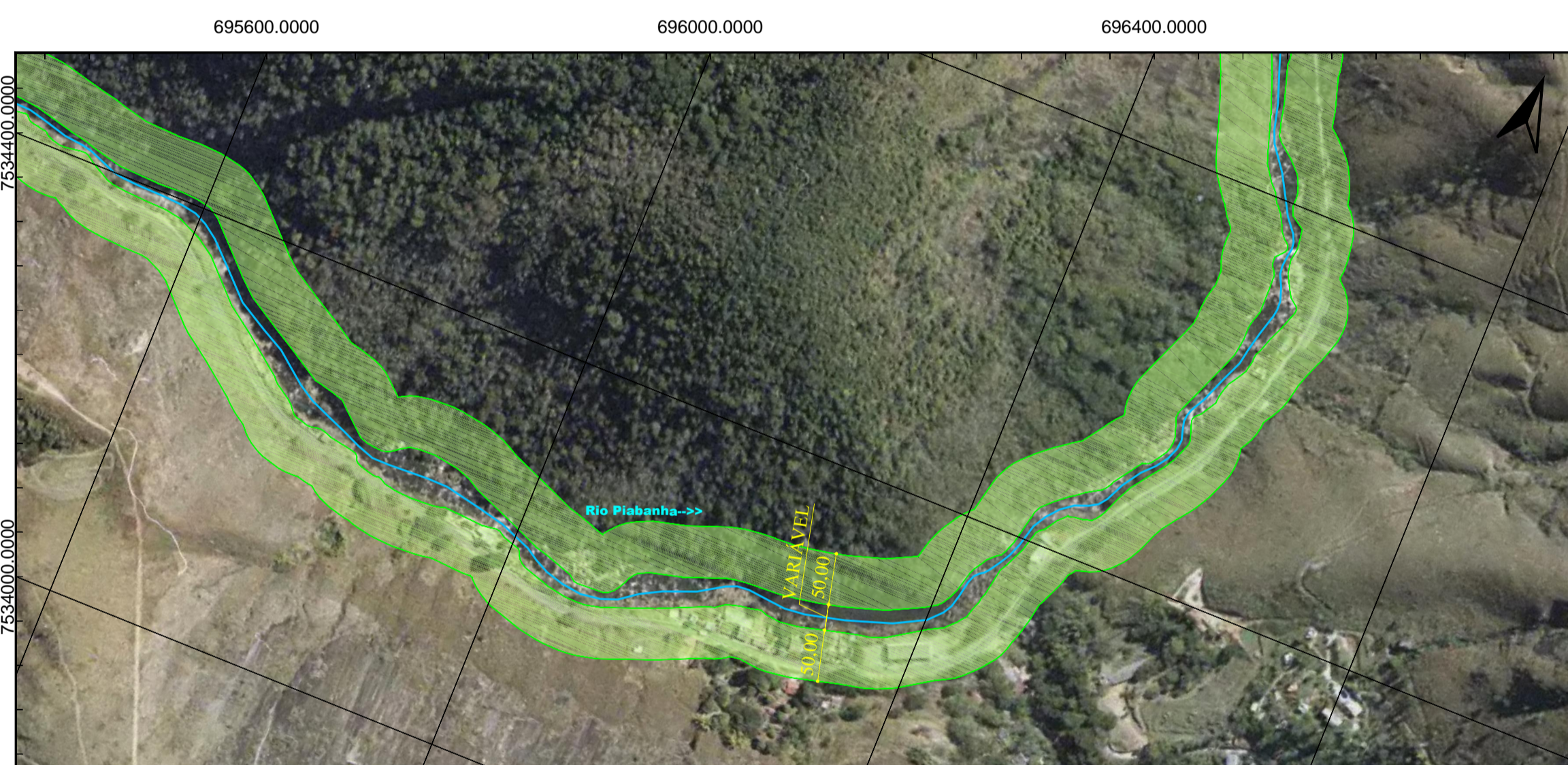
4 TRECHO 20 ESCALA - 1:5.000