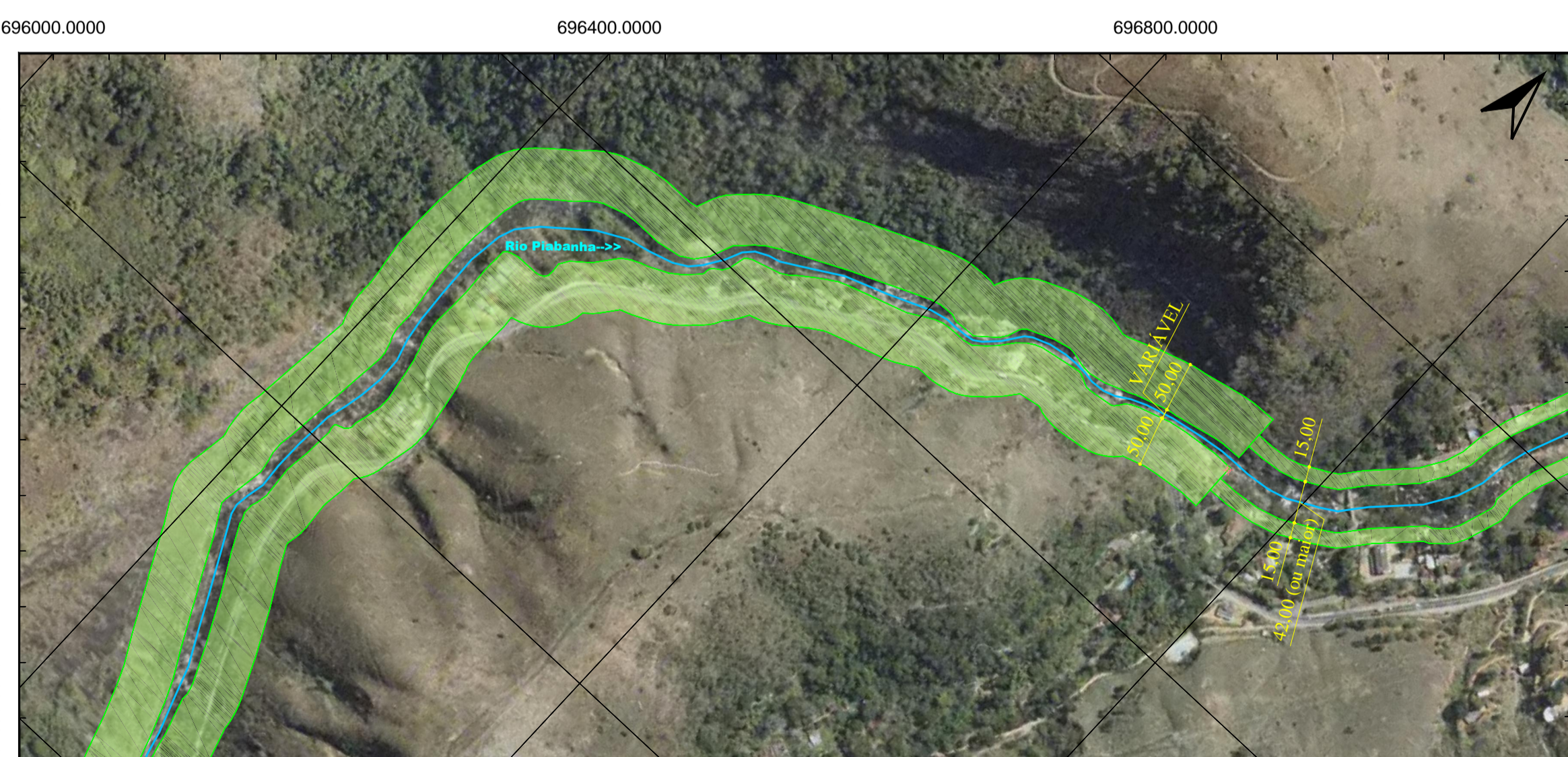
5 TRECHO 21 ESCALA - 1:5.000