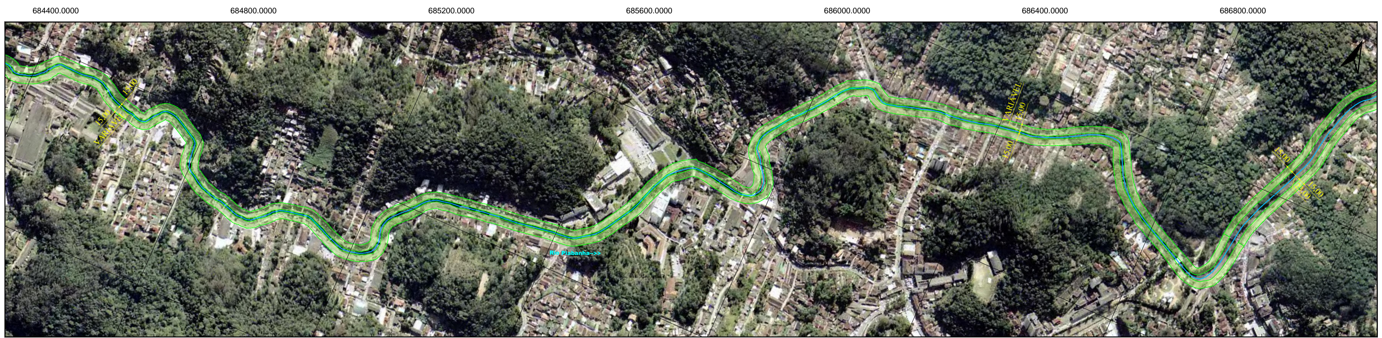
4 TRECHO 4 ESCALA - 1:5.000