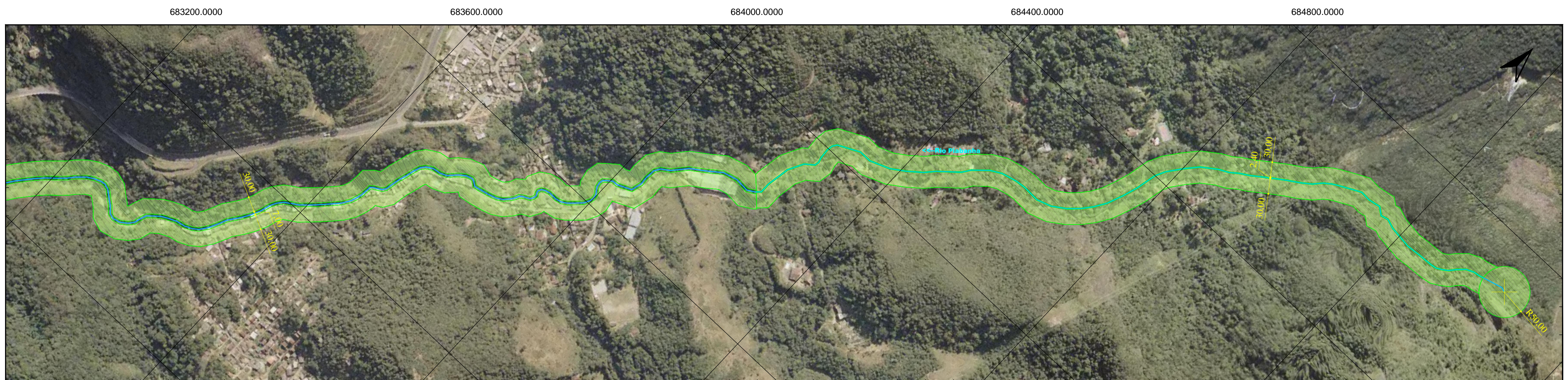
1 TRECHO 1 ESCALA - 1:5.000