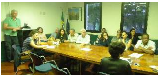
Equipe UD2 - AGEVAP

O comitê esteve presente no Seminário de Apresentação do Diagnóstico do Plano Municipal de Saneamento Básico de Teresópolis realizado no dia 5 de agosto de 2014, no qual foram esclarecidas dúvidas, feitas sugestões e críticas à empresa responsável. Tem também acompanhado os planos de Carmo, Sapucaia, Sumidouro, Areal e São José do Vale do Rio Preto diretamente com a SEA e com os respectivos municípios. Esteve, também, presente na Audiência Pública do Plano Municipal de Saneamento Básico de Petrópolis, realizada no dia 1 de agosto de 2014.