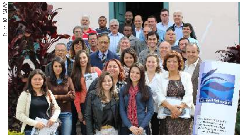
Equipe UD2 - AGEVAP

O comitê esteve presente no Seminário de Apresentação do Diagnóstico do Plano Municipal de Saneamento Básico de Teresópolis realizado no dia 5 de agosto de 2014, no qual foram esclarecidas dúvidas, feitas sugestões e críticas à empresa responsável. Tem também acompanhado os planos de Carmo, Sapucaia, Sumidouro, Areal e São José do Vale do Rio Preto diretamente com a SEA e com os respectivos municípios. Esteve, também, presente na Audiência Pública do Plano Municipal de Saneamento Básico de Petrópolis, realizada no dia 1 de agosto de 2014.