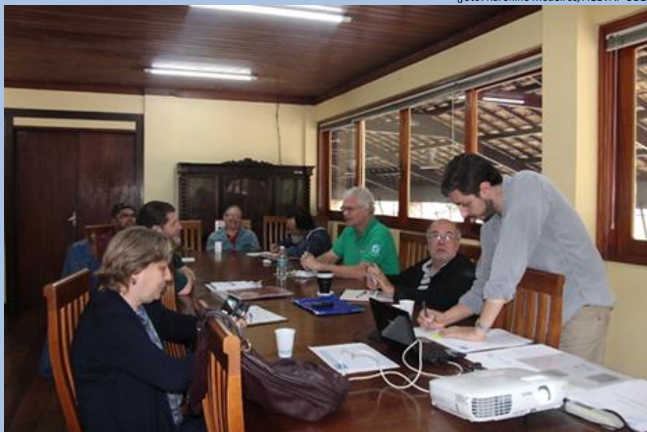
Diretores e membros da Câmara Técnica reunidos para a 62ª Reunião do Diretório Colegiado