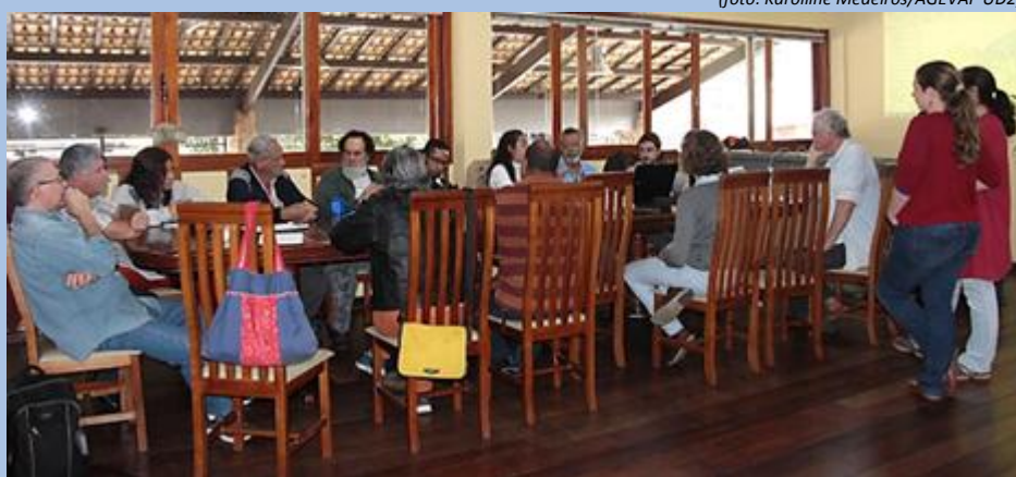
Reunião foi realizada na sala da Secretaria de Serviços, Segurança e Ordem Pública

Foi realizada no dia 14 de junho a 1ª Reunião do Grupo de Trabalho Águas Subterrâneas da Câmara Técnica, em Petrópolis/RJ. Na ocasião, os membros discutiram sobre a situação hídrica do município de São José do Vale do Rio Preto e estabeleceram objetivos, metas e prazos referentes ao levantamento de informações sobre águas subterrâneas da Região Hidrográfica IV.