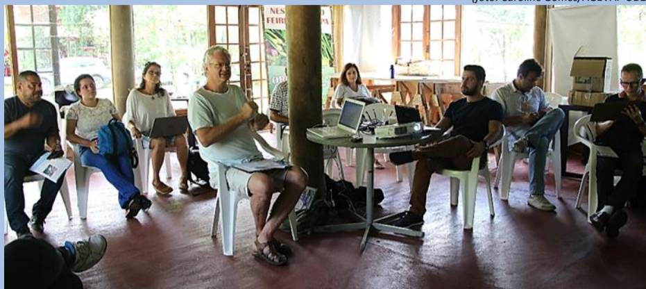
Membros dos GTs do Comitê Piabanha durante 10ª Reunião do GT Sistema de Informações

A sede da Área de Proteção Ambiental (APA) de Petrópolis recebeu a 10ª Reunião Ordinária do Grupo de Trabalho Sistema de Informação do Comitê ampliada às demais instâncias, no dia 16 de janeiro. Durante o encontro, os participantes discutiram sobre o principal item de pauta: os dados georreferenciados recebidos através do Banco de Dados Espaciais do INEA (BDE/INEA) e outras fontes, conhecidas coletivamente como "Conhecendo Nosso Território".