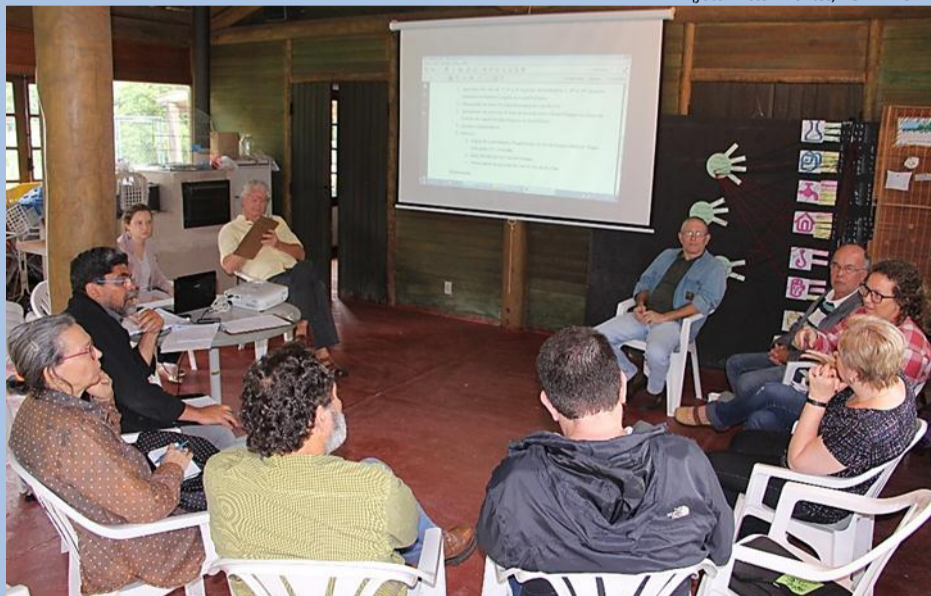
Diretores do Comitê Piabanha se reúnem para sua 60ª Reunião

A 60ª Reunião do Diretório Colegiado foi realizada em Petrópolis, no dia 30 de janeiro. Na ocasião, foi apresentado aos diretores o Planejamento de Ações do Comitê Piabanha para o ano de 2018 e as propostas de temas para discussão na Câmara Técnica e nos Grupos de Trabalho. Além disso, os Diretores discutiram sobre a Oficina de Cadastramento e Regularização do Uso de Recursos Hídricos da Região Hidrográfica IV - Piabanha, o Edital PROPESQUISA Comitê Piabanha e o abastecimento de água em São José do Vale do Rio Preto.