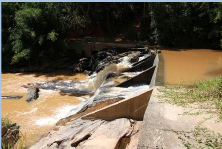
PCH Paquequer