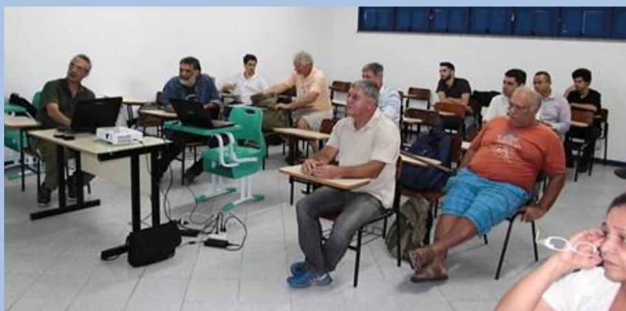
6ª Reunião do Grupo de Trabalho Sistemas de Informações

No dia 6 de abril foi realizada a 6ª Reunião do Grupo de Trabalho Sistemas de Informações, no município de Teresópolis. Na ocasião, foi realizado um voo demonstrativo com um Veículo Aéreo não Tripulado (VANT). Após o voo, foram discutidos os seguintes assuntos: trocas de experiências, desafios, problemas e soluções no uso do equipamento; processamento de imagens, apresentação de resultados preliminares e discussões; próximos passos; entre outros.