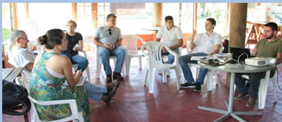
56ª Reunião do Diretório Colegiado

O Comitê Piabanha realizou, no dia 4 de abril, a 56ª Reunião do Diretório Colegiado. O plenário, que aconteceu no município de Petrópolis, debateu os seguintes assuntos: aprovação da ata da 55ª Reunião do Diretório Colegiado; encaminhamento em relação às informações solicitadas à COMDEP; encaminhamento do GT Saneamento referente ao TdR do Curso de Biossistemas; possibilidade de Incorporação ao TdR Plano de Bacia do Paraíba do Sul; recomendação da Câmara Técnica referente ao TdR Plano de Recursos Hídricos; apresentação da minuta de Resolução sobre Diárias, reembolsos e ajudas de custo; andamento das visitas às prefeituras da RH-IV; apresentação do relatório da visita à ETE de Carmo; entre outros.