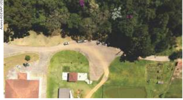
Foto do Phantom 4 durante voo demonstrativo na UNIFESO

Com o intuito de apresentar a tecnologia de Veículos Aéreos Não Tripulados (VANT) e conhecer as potencialidades de aplicação para estudos e pesquisas que auxiliem na gestão de recursos hídricos, o Comitê Piabanha realizou sua 6ª reunião do GT Sistemas de Informação, no dia 6 de abril, na UNIFESO. Foram apresentados exemplos de aplicação em pesquisas e em monitoramento, e em seguida, foi realizado um voo demonstrativo com o drone Phantom 4.