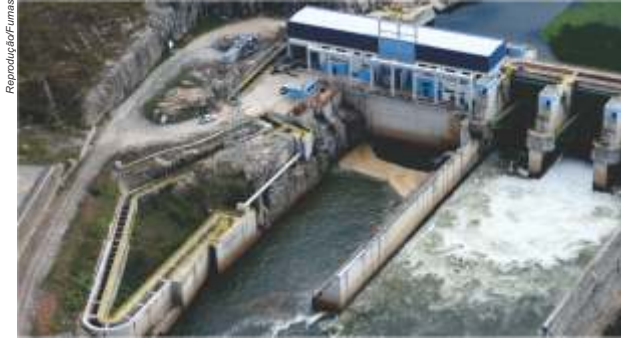
Usina hidrelétrica de Simplicio visitada pelo Comitê Piabanha

O Comitê Piabanha promoveu uma visita, em abril de 2017, às usinas hidrelétricas de Anta e Simplicio, no rio Paraíba do Sul. A visita faz parte do levantamento dos Aproveitamentos Hidrelétricos da Região Hidrográfica IV, em andamento pelo Programa de Residência do Comitê Piabanha. Seu objetivo é mapear os trechos de vazão reduzida e, principalmente, conhecer o monitoramento hidrometeorológico realizado pelas empresas.