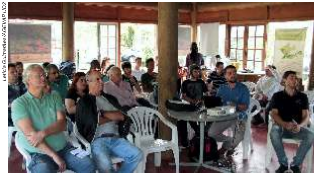
Membros do Comitê Piabanha reúnem-se na APA Petrópolis

Em fevereiro, o Comitê aprovou o Termo de Referência (TdR) para elaboração de seu Plano de Bacia. Porém, o Plenário decidiu alinhar-se com os Planos de Ação de Recursos Hídricos dos comitês afluentes do Paraíba do Sul que estão sendo contratados pelo CEIVAP e contemplarão mobilização social e legislação do Rio de Janeiro. Dessa forma, estarão aptos para serem adotados como Planos de Bacia e os nossos recursos serão otimizados e utilizados para informações complementares.