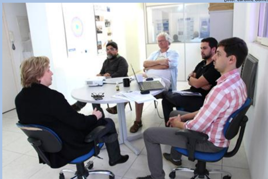
57ª Reunião do Diretório Colegiado do Comitê Piabanha.

No dia 30 de maio foi realizada a 57ª Reunião do Diretório Colegiado, na nova Sede do Comitê Piabanha e da Unidade Descentralizada 2 da AGEVAP, em Petrópolis. Na ocasião, foi apresentado o novo escritório aos Diretores do Comitê e discutidos os seguintes assuntos: atualização dos valores do Plano de Aplicação Plurianual de acordo com o valor do PPU, sustentabilidade do Sistema de Recursos Hídricos em relação à compensação financeira do setor elétrico, ações para a ampliação da base de cadastro de Usuários de Recursos Hídricos na RH-IV, definição de Coordenadores para o GT-PSA Hídrico, GT-Educomunicação e GT-Plano de Bacia, planejamento para o Processo Eleitoral do Comitê Piabanha (dez/2017 a dez/2021) e discussão sobre a recomposição do Diretório Colegiado, caso não seja possível o retorno do Presidente do Comitê, entre outros.