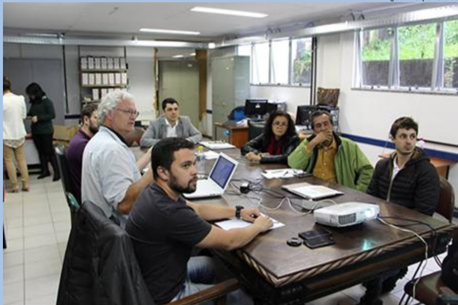
Reunião com a Prefeitura de Petrópolis.