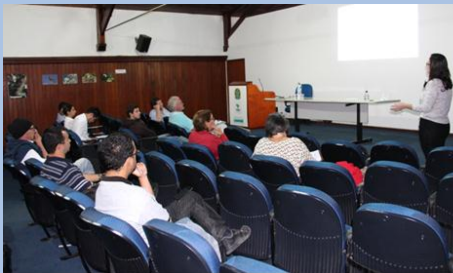
37ª Reunião da Câmara Técnica do Comitê Piabanha.

O Comitê Piabanha realizou sua 37ª Reunião da Câmara Técnica, no dia 25 de maio, na Sede do Parnaso, em Teresópolis. Trata-se da segunda de uma série de cinco reuniões para discussão sobre a revisão da metodologia da cobrança pelos recursos hídricos da Região Hidrográfica IV do Estado do Rio de Janeiro, área de atuação do Comitê Piabanha.